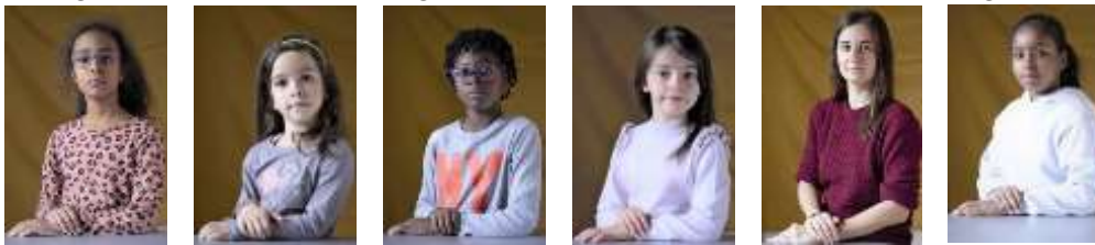
photo. Le résultat est très chouette.

Le thème sur Léonardo da Vinci a eu beaucoup de succès. De nombreux enfants en avaient déjà entendu parler. Cela a inspiré un atelier montgolfière, des portraits style « Joconde » où les enfants ont pu s'essayer au métier de photographe, chacun se chargeant d'une tâche : organiser la prise de vue, faire le cadrage et prendre la